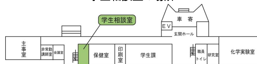
A(旧ソーシャルデザイン工学科講義)棟 1階