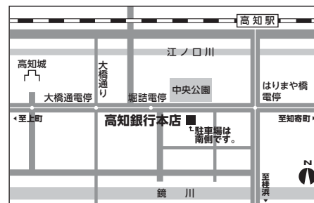
※駐車場に限りがございますので、できる限り公共交通機関をご利用ください。