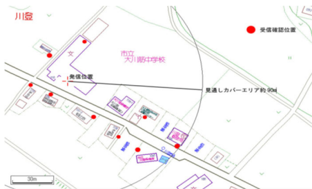
電波到達エリアの検証