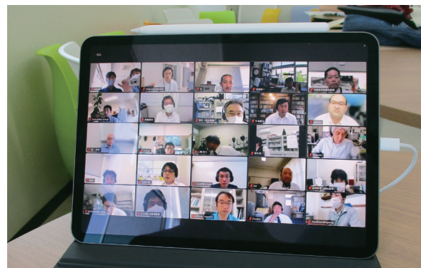
学内での FD・SD 研修会 On-campus FD・SD Seminar

*For activities done in academic year 2022, see "Activities for Educational Improvement and Staff Development" on page 35.