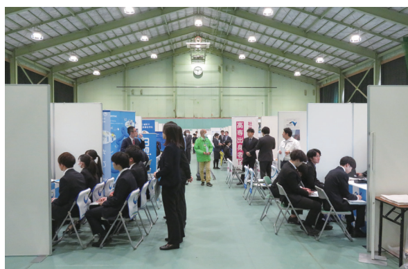
進路研究セミナー (12 月) Career Research Seminar (in December)

The Learning Support Office was established in 2016 in the Comprehensive Student Support Center. It aims to provide assistance on students' academic aspect with close cooperation with Student Counseling Office and Career Support Office.