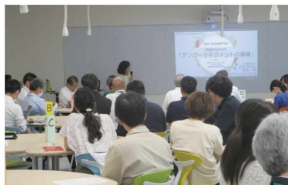
学内での FD・SD 研修会 On-campus FD・SD Seminar

*For activities done in academic year 2022, see "Activities for Educational Improvement and Staff Development" on page 35.