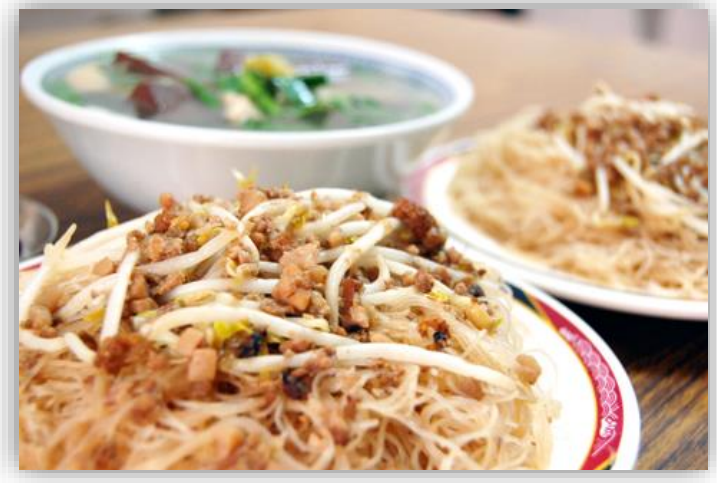
炒米粉(ビーフン炒め)