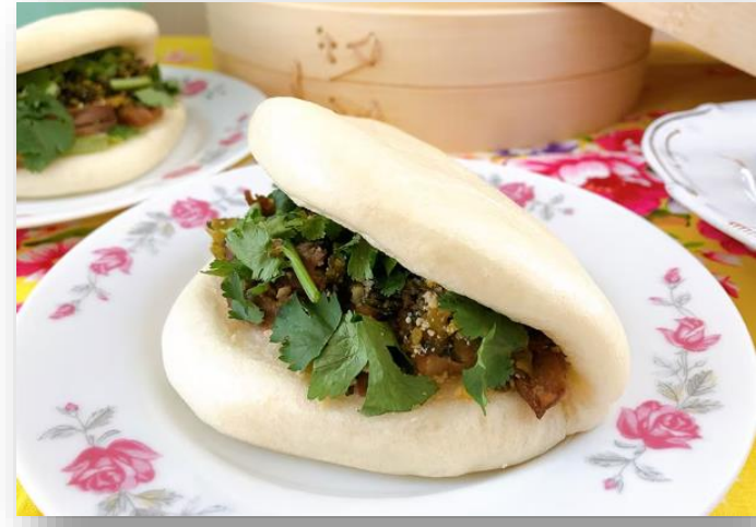
割包(台湾風バーガー)