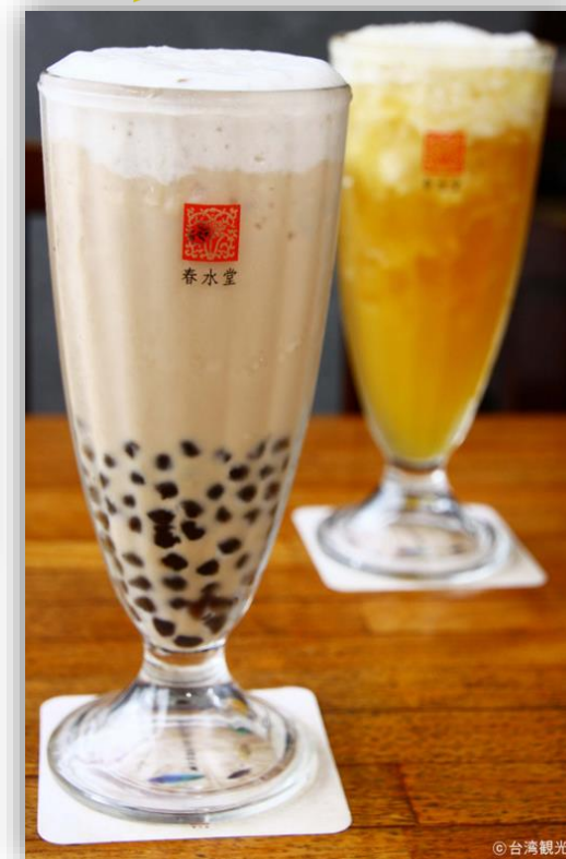
タピオカミルクティー