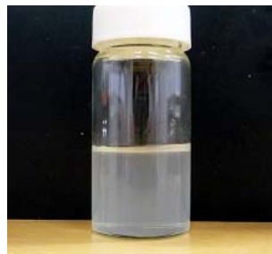
乳化剤無しで長期安定している椿油 (5年間継続中)

コンパクトなエマルション作製手法について研究をおこなっています。そのコンパクトなサイズのため、市場ニーズに即対応できるコンパクトラインへの導入が期待されます。