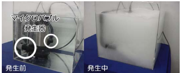
※ 地元高知県内企業 (株) 坂本技研と共同開発した水産向けファインバブル (マイクロ・ナノバブル) 発生器

ファインバブル (マイクロ・ナノバブル) とはサブミクロン・ナノサイズを含み直径 100 μm 未満の微細気泡を指します。気泡は、このくらいの微小さとなると、内包気体の溶解効率が上昇することや表面電荷を有することが分かっています。このようなユニークな性質を利用して、農林水産や洗浄、環境浄化、食品分野等の機能改善や高付加価値に関する研究をおこなっています。