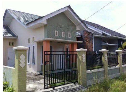
図1 インドネシアで一般的に普及している住宅

東南アジアにおいて、現地の経済的・技術的・環境的実現性を考慮した環境配慮型建物の普及を研究するに当たり、初期段階として、現地技術者の技能レベルや住宅購買層の経済的状況や環境意識を把握する必要がある。そこで現在は、共同研究実施機関であるインドネシア・アンダラス大学の研究者に協力をいただき、パダン市における室内環境に関する意識調査を行っている。