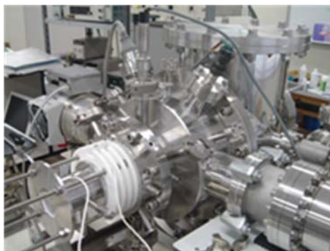
図1 大気圧イオン化質量分析装置

大気圧イオン化質量分析装置(図1)を用いてコロナ放電や大気圧プラズマによって発生するイオンの質量スペクトルの測定を行い、イオン種の同定およびイオン生成反応の解析・モデル化を行っています。図2はイオンの質量分析の結果から推定した空気中のコロナ放電で生成した負イオンの反応モデルです。そのほかにも、大気圧化学イオン化を利用した大気微量成分の分析法や、イオン移動度分析法を用いたナノサイズ微粒子の計測法の開発も進めています。