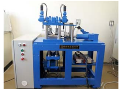
高知高専型 動的一面せん断試験