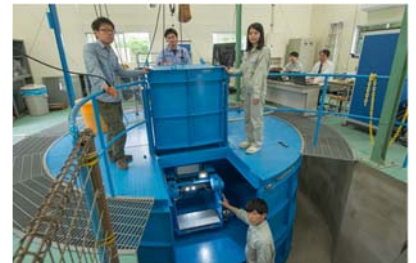
動的遠心力模型実験