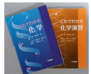
図2 これでわかるシリーズ