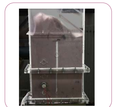
流動層における熱流動計測